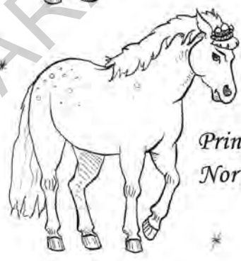
Prințesa Nor Alb