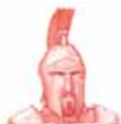
ARES Zeul războiului