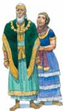
PRIAM ȘI HECUBA Regele și regina Troiei