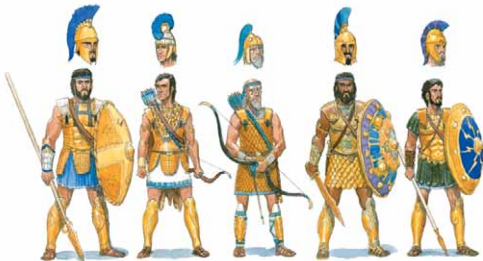
HECTOR Fiul lui Priam Prinț al Troiei