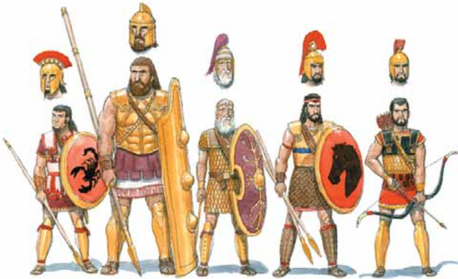
„MICUL“ AJAX Fiul lui Oileus Prințul cetății Locris