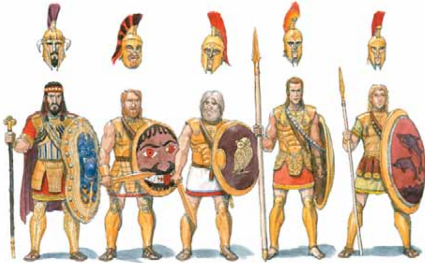
AGAMEMNON Fiul lui Atreu Marele rege din Micene