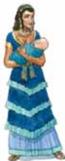
ANDROMACA ȘI SCAMANDRIUS (ASTIANAX) Soția și fiul lui Hector